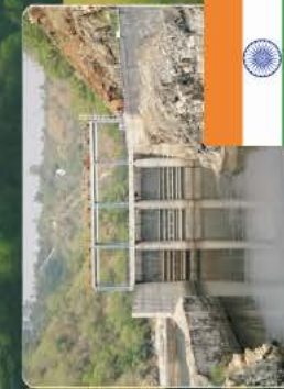
Indien: Saubere Energie aus Wasserkraft

Wir machen unseren Verbrauch klimaneutral. Machen Sie mit!