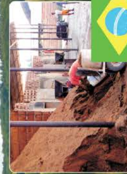
Brasilien: Brennstoffwechsel reduziert Abholzung