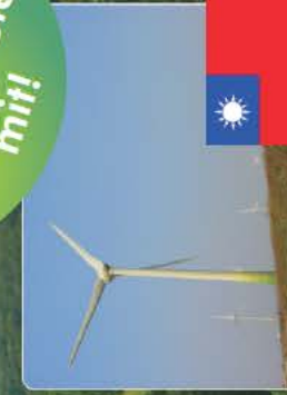
Taiwan: Saubere Energie aus Windkraft

Genauere Informationen zu unseren Projekten finden Sie unter www.stadtwerke-marburg.de/klimaschutz